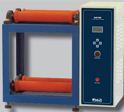
BML-2 mit bis zu 2 Plätzen

mit 2 oder 6 Plätzen, 50 - 600 U/Min, programmierbar, Schallschutzgehäuse optional